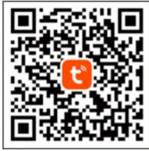
Tuya Smart APP

For usage of controller by application. You can choose TUYA app or SMART LIFE app. Please scan QR code for Tuya APP or Smart Life APP. After installation one of the application, please follow the application instruction for add new smart light. The device will be visible as 'WS001'.