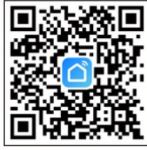
Smart Life APP

CONTROLLER Wi-Fi installation (should be similar to APP instructions)